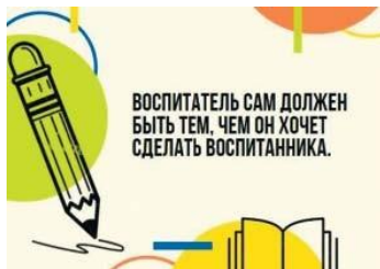
Рис. П2.2. Пример карточки с цитатой